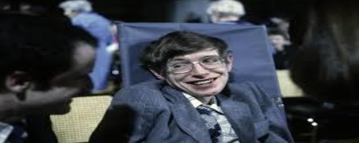
AYIN BİLİM İNSANI : STEPHAN HAWKİNG