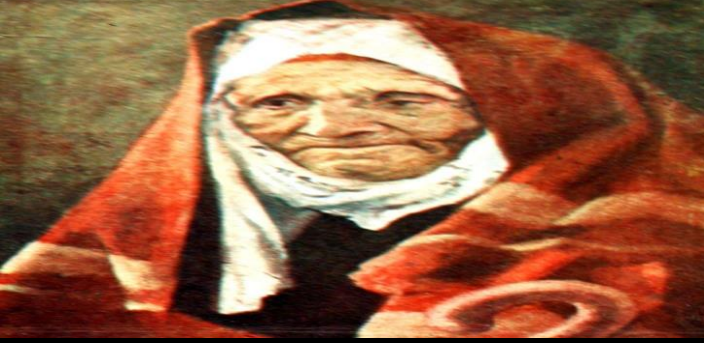
AYIN TARİHİ VE TURİSTİK YERİ: LOUVRE MÜZESİ